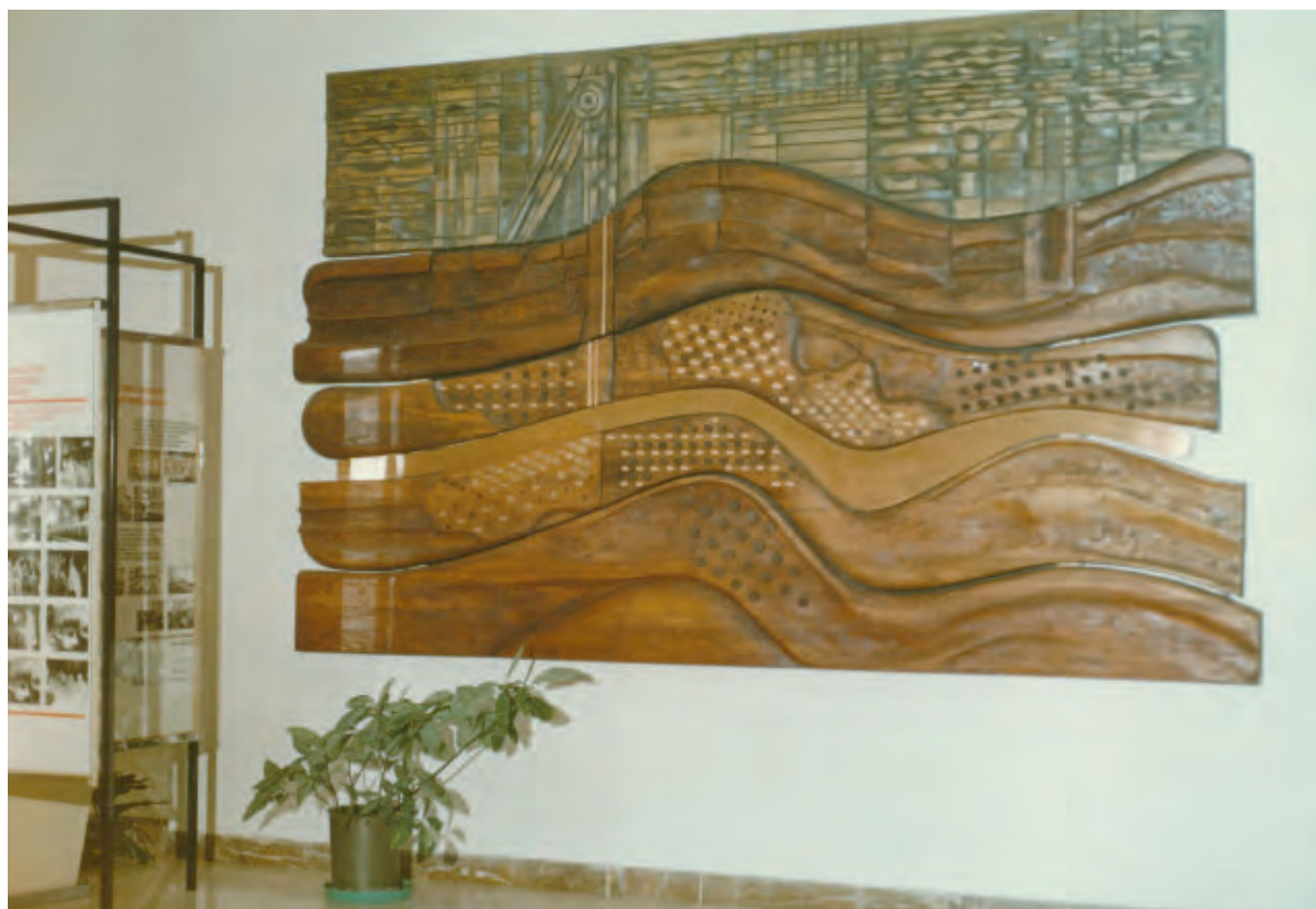
Reliéf v hale tzv. Pentagonu (SOKA Jeseník)

Objednávky směřoval na umělce, pocházející především z Olomouce, ale pár zakázek dostali i umělci z Brna. Ne všechny zakázky byly dotaženy do konce a ne vše bylo nakonec zrealizováno.