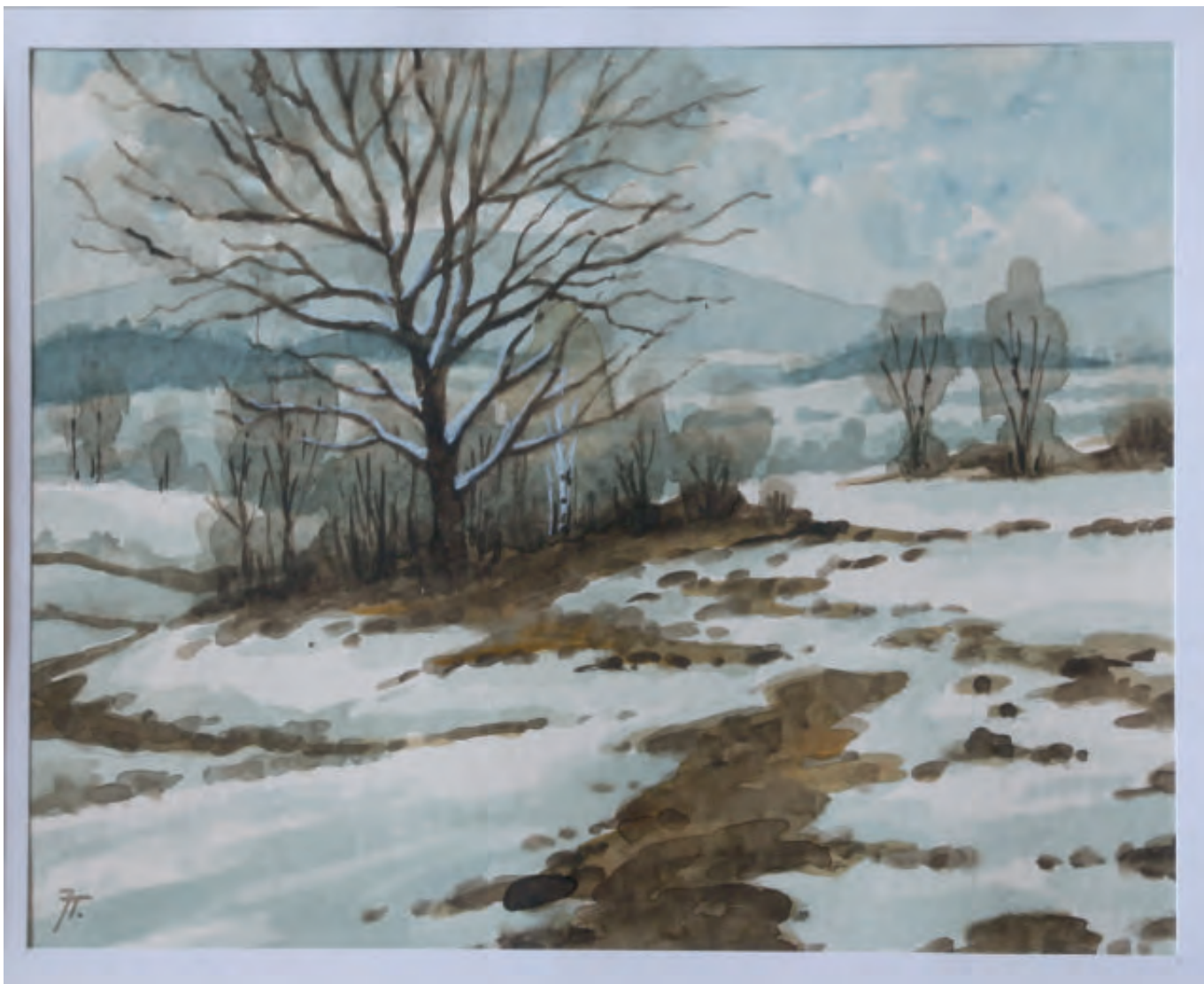
Jindřich Turek, Zimní krajina (VMJ Jeseník)