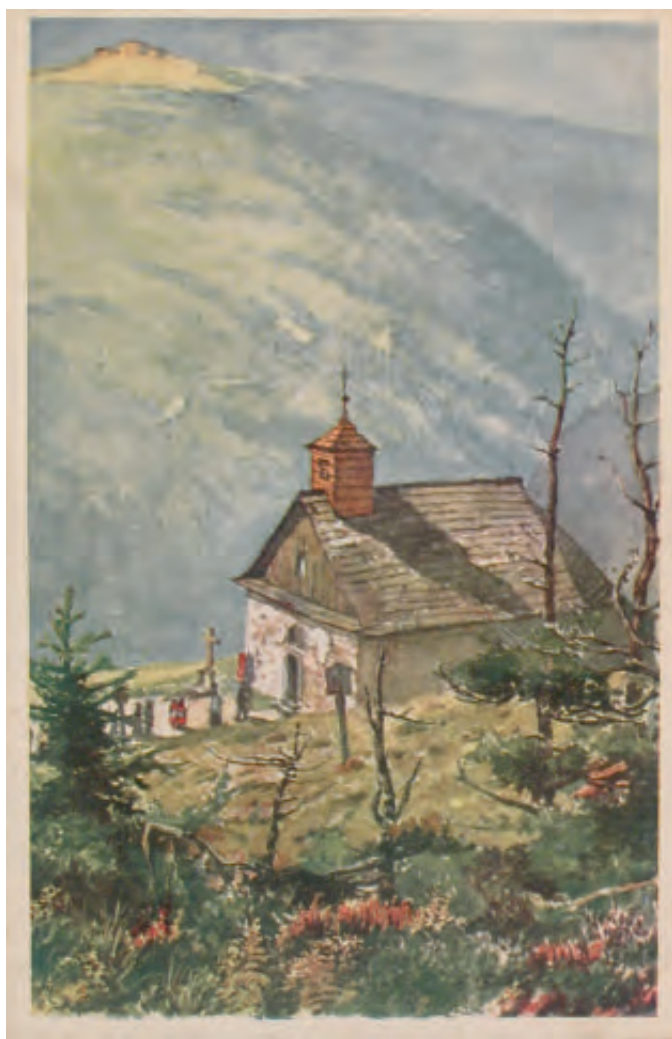
E. F. Hofecker, Vřesová studánka , 1912 (Vlastivědné muzeum v Šumperku, H 12155)