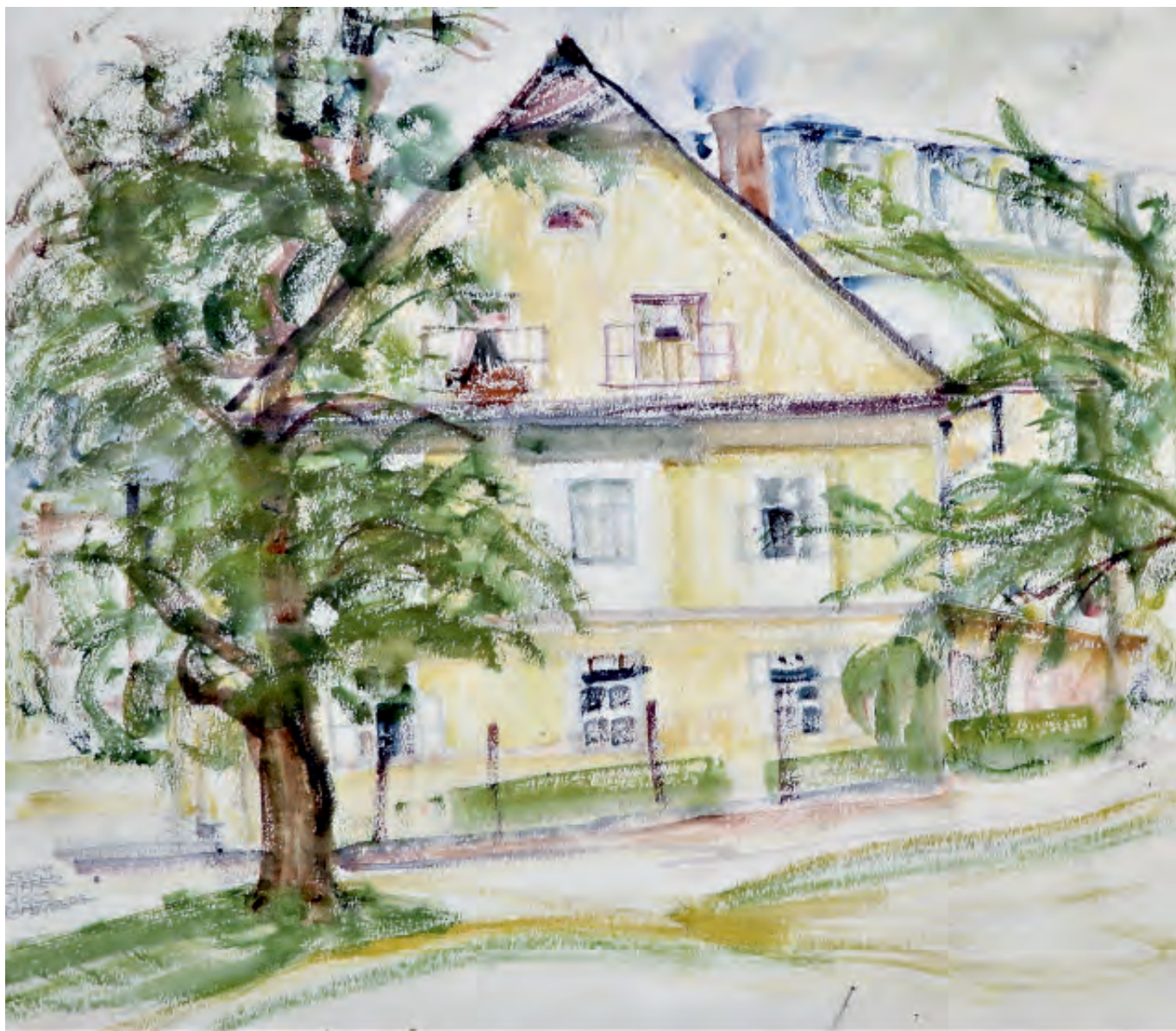
E. Ziffer, Neugebauerův dům , 1922 (SZM v Opavě, inv. č. U876A)

práce provedené akvarelem lze charakterizovat jako kresby i malby. Nejstarší kresby nesou letopočet vzniku 1917, nejmladší datovaná kresba vznikla v roce 1923. Ze souboru se vymyká kolorovaná kresba nemocnice ve Fulneku, vytvořená na tuhém kartonu, 8 kterou známe z publikace v revui Der Bautechniker . Zbylou skupinu kreseb si tematicky rozdělme.