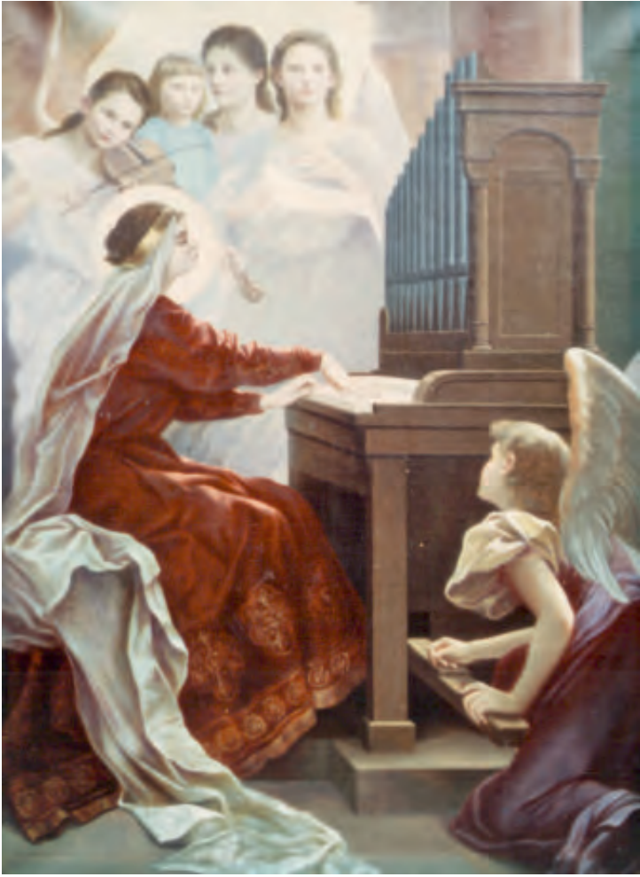
Alois Bauch: Svatá Cecílie, 1919 (soukr. sb.)