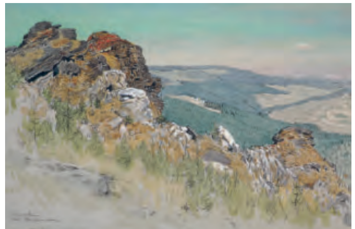
Adolf Zdravila, Skály na Supí hoře (reprofoto)

V rámci projektu o zachování slezské kultury zachytil Zdravila realistickými akvarely řadu památkových staveb v Opavě a jejím okolí. Zaměřil se zvláště na lidovou architekturu a krajinný charakter nejen Opavska, ale i Jesenicka. Z jeho díla stylu Heimatkunst zmiňme práce jako Stará pošta v Cukmantlu (1905) 29 , Žulová , Pohled na město s kostelem 30 a Skály na Supí hoře s pohledem na krajinu u Rejvízu 31 .