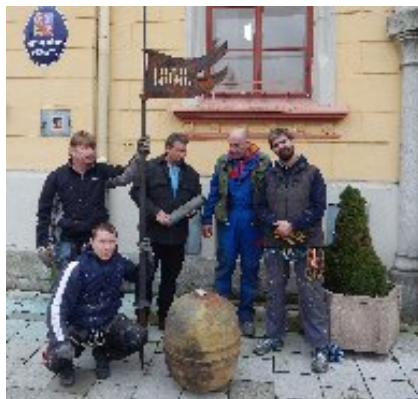
Demontáž makovice vidnavské radnice