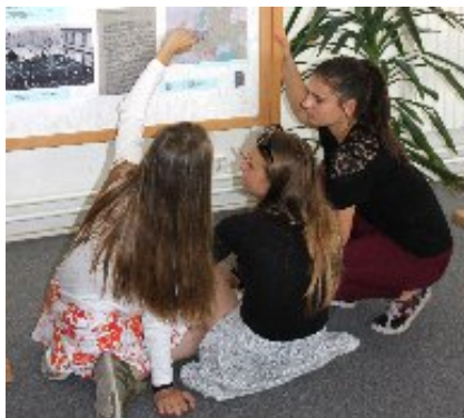
Hledání odpovědi na soutěžní otázku (SOkA Jeseník)