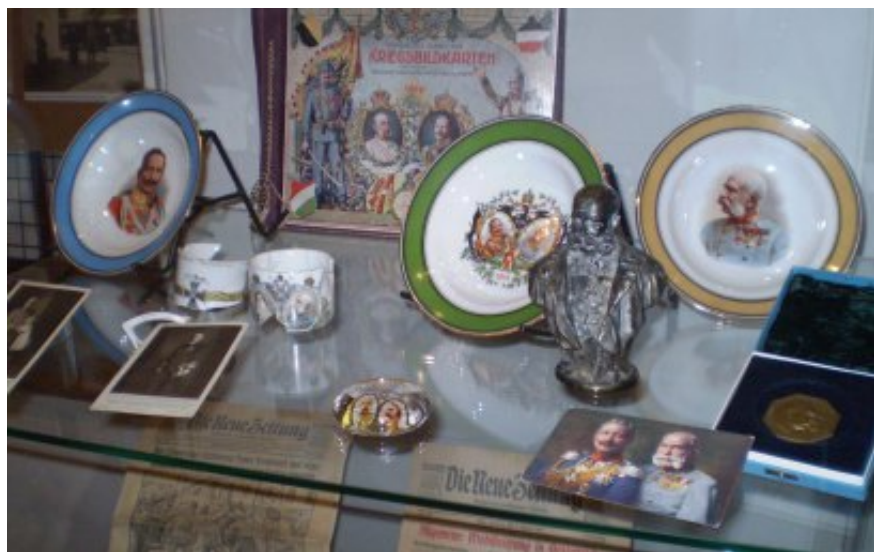
Ukázky německo-rakouského „válečného přátelství“

příklad použité šrapnelu. Závěrečný textový panel byl věnován vzniku ČSR a tzv. Sudetenlandu. K tomuto účelu byl vytvořen tzv. československý koutek s legionářskou uniformou a oslavnými manifesty ke vzniku republiky. Tato část však symbolicky kontrastovala s blízkým sloupem s plakátovací plochou, jejíž závěrečnou část naopak zdobilo provolání Německého Rakouska či pozdější, již dvojjazyčné, vyhlášky ke zklidnění situace v pohraničí. Této problematice se věnovala rovněž poslední vitrína, např. v podobě nařízení starosty Jeseníku ke klidu a pořádku při obsazování města československým vojskem. Poslední exponáty zastupovaly osobu vypravěče výstavy A. M. Schosse, zejména originál strojpisu vydaných vzpomínek.