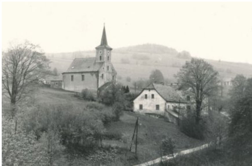
Kostel v Zálesí - stav před demolicí