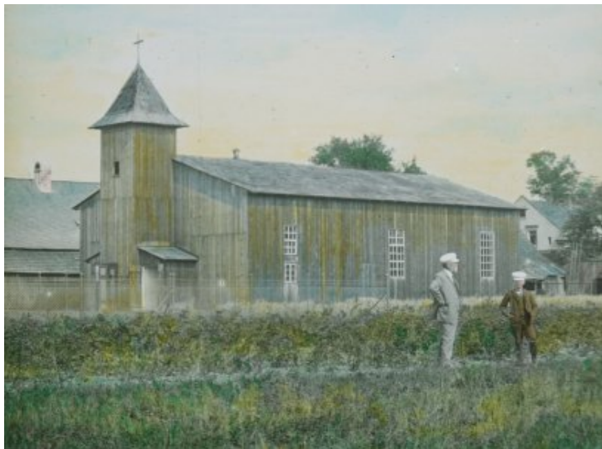
Provizorní kostel v Mikulovicích, 1903

tografa Josefa Fuhrmanna. Tehdy se snímalo na skleněné desky různých formátů a vyvolané negativy se používaly přímo pro kopírování pozitivu.