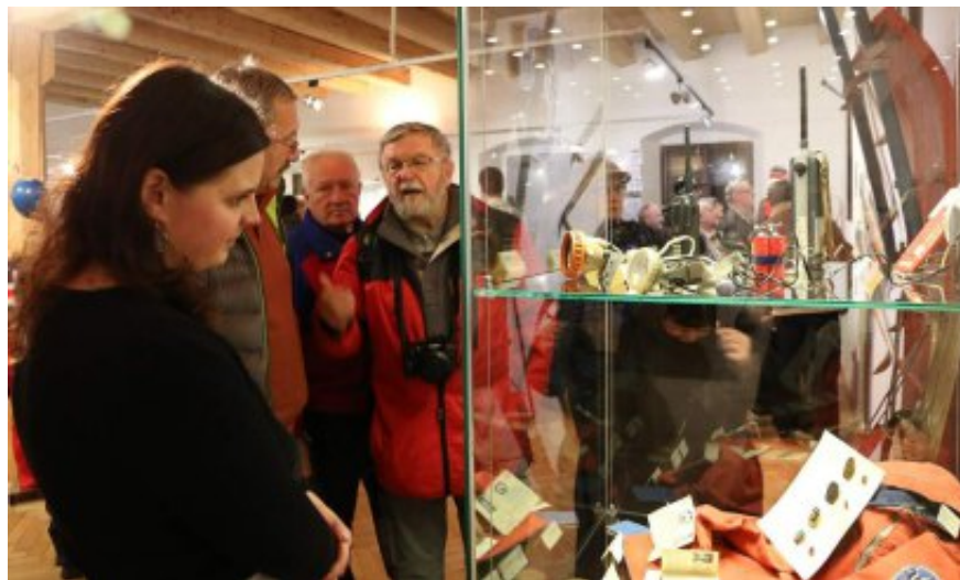
Na vernisáži se potkali pamětníci zimních sportů (VMJ Jeseník)