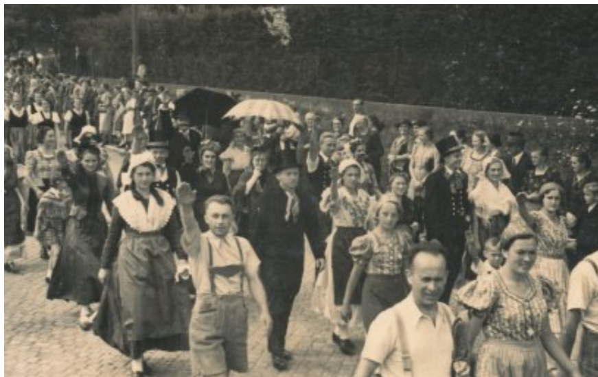
Krojovaný průvod Němců v Bukovicích 1. května 1938

zmírnění protistátních projevů ve dnech 21. a 22. května, nicméně po té opět referoval o stoupajícím napětí a víře německého lidu v brzké sloučení sudetoněmeckých krajů s Německem, ačkoliv termín uvedeného aktu se neustále měnil a posouval.