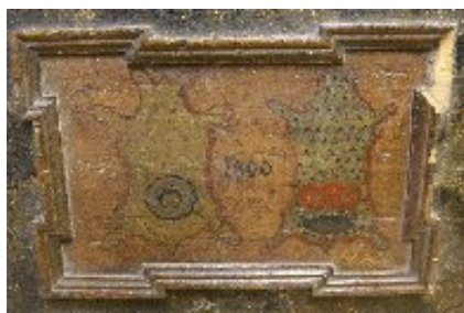
Detail truhlice jesenického cechu kožešníků a jirchářů, 1800 (VMJ)

Další truhlice pochází z majetku cechu jirchářů a kožešníků. Zmíněný cech je v Jeseníku doložen až od roku 1800, kdy podle zápisu o vystoupení jesenických kožešníků ze stejnojmenného cechu v Javorníku vznikl v Jeseníku samostatný cech tohoto řemesla. Potvrzuje to nejen první zápis v cechovní knize, ale také cechovní pečeť ze stejného roku. Jircháři (Weißeberger) se postupem doby vydělili z původního řemesla koželuhů. Jejich profese se specializovala především na zpracování jemných kůží. Díky zápachům z vydělaného materiálu se jejich živnosti nacházely většinou u řeky mimo město. Kožešníci (Kürschner nebo také Kirschner) vyráběli kožichy, blány (kožešinové výrobky bez textilního potahu), čepice a podšívky oděvů. V menších městech, k nimž patřil i Jeseník, se tyto příbuzné profese často spojovaly do společných cechů. 6