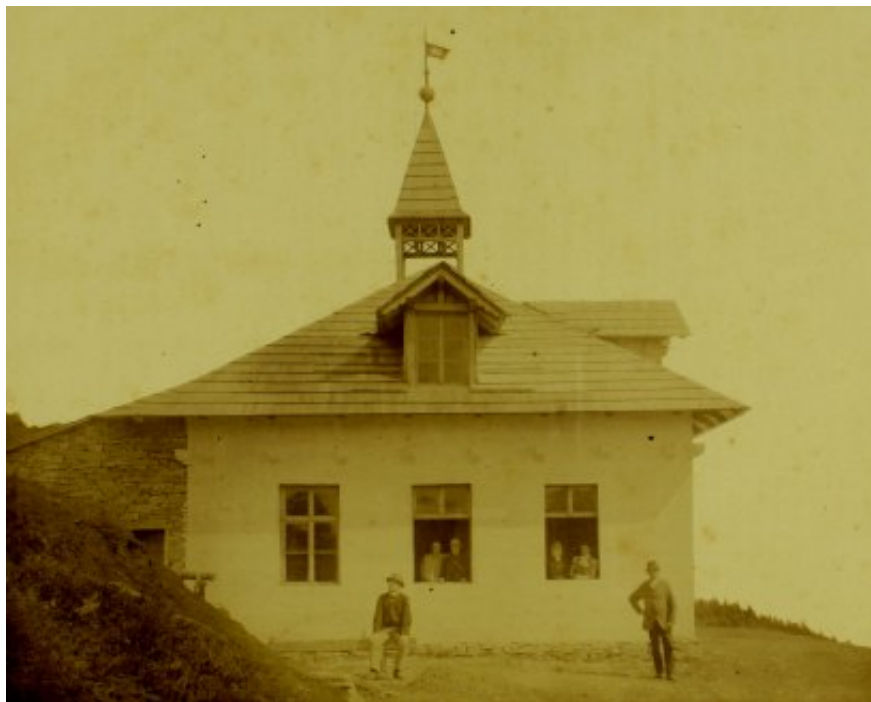
Jiřího chata na Šeráku před požárem