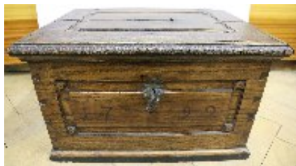
Truhlice jesenického cechu řezníků, 1792 (VMJ)

V obdélníku přední stěny truhlice je vyobrazen letopočet 1792. V obdélníku levé boční stěny truhlice najdeme cechovní znamení v podobě dvou zkřížených řeznických seker. V obdélníku pravé boční stěny je pak vyobrazeno pouto pro dobytek. Uvnitř truhlice je na levé straně umístěna přihrádka na cechovní pečeť a peníze. 5