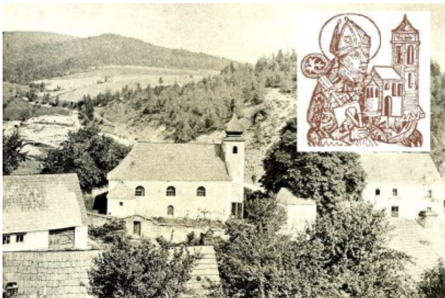
Starý kostel v Travné zasvěcený sv. Wolfgangovi