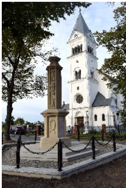
Kapsův pomník v Bílém Potoce