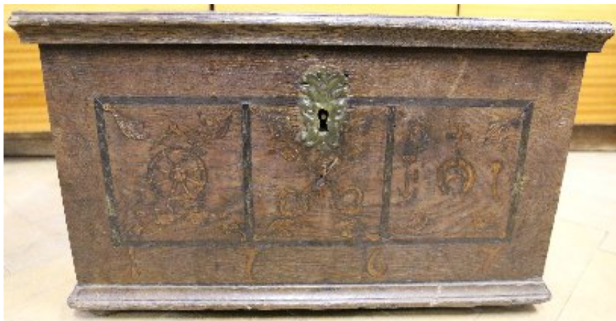
Detail truhlice sdruženého cechu zámečnicků, kolářů, sedlářů a kovářů, 1767 (VMJ)

Třetí truhlice pochází z majetku jesenického cechu ševců. Ševci (Schuster, Schuhmacher) byli tradiční výrobci všech druhů kožené obuvi. Ze ševců se pak vydělili příštipkáři, kteří se zabývali pouze opravou bot nebo jejich zhotovováním z nepříliš kvalitní kůže. 8 Dřevěná cechovní truhlice jesenického cechu ševců pochází z 2. poloviny 19. století. Dřevěné víko truhlice je na horní straně ozdobeno obdélníkovým komolým jehlanem. Na vnitřní straně víka jsou umístěny dva kovové panty přichycené na zadní stěně truhlice. V jednoduché nezdobené přední stěně se nachází poškozovaný jednozápadkový zámek, jehož klíčnicí otvor je kryt ozdobným kováním. Na obou bočních stěnách truhlice najdeme kovová držadla, na levé straně uvnitř truhlice je umístěna přihrádka na cechovní pečeť a peníze. 9