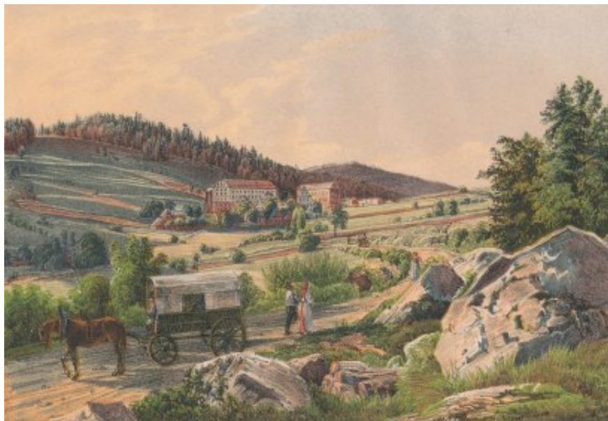
Gräfenberk po roce 1839