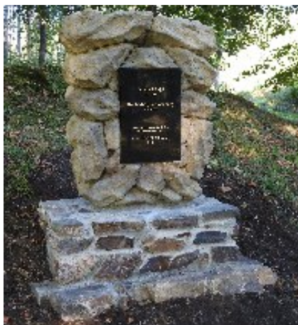
Pomník u sanatoria Edel