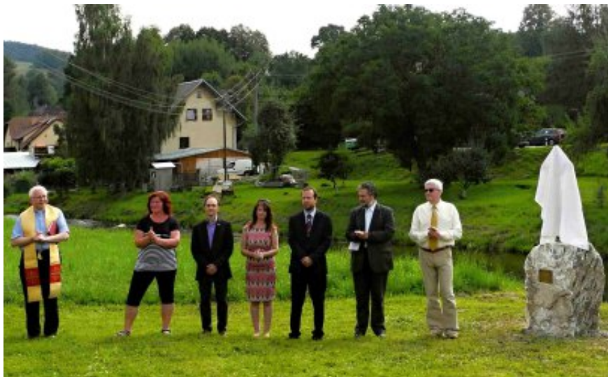
Odhalení kříže, maďarský velvyslanec druhý zprava