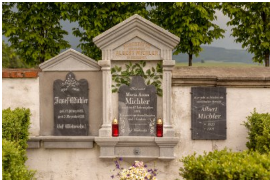
Hrobka rodiny v Bernarticích, 2017

Všechny podniky rodin Michler a Bude byly roku 1945 zkonfiskovány na základě dekretů č. 12/1945 Sb. o konfiskaci zemědělského majetku a 108/1945 Sb. o konfiskaci ostatního, nezemědělského majetku a živností osob německé národnosti.