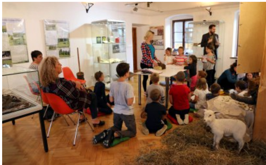
Edukační program pro žáky ZŠ Písečná (VMJ Jeseník)